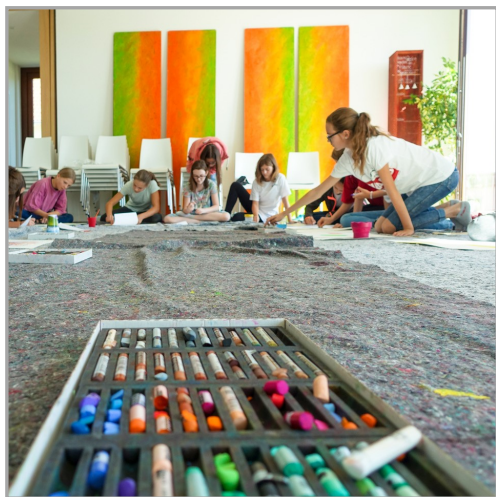
Einblick in die Konfiarbeit zum Thema „Heilig“ - Kreative Phase

Und was macht eigentlich der aktuelle Jahrgang 2020?