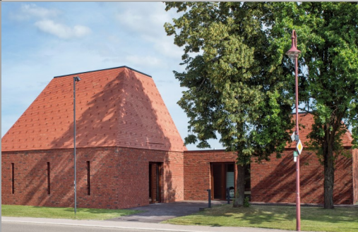
Paulus-Haus in 69254 Malsch: Rotenbergerstr. 38

Gemeindehaus in 69231 Rauenberg: Hauptstr. 59