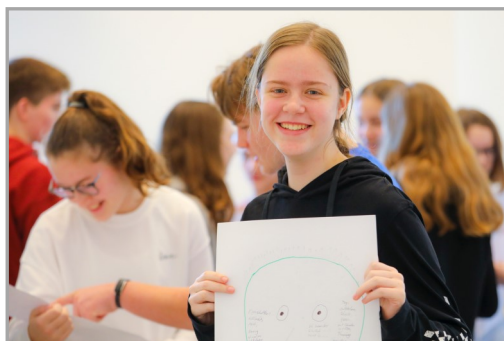
erst Konfi, dann Teamer: Die Konfiteamer!

Kein Problem, denn Gott ist schon unter uns, wenn sich zwei in seinem Namen versammeln. Das klappt auf jeden Fall!