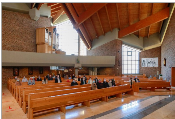
Mein rechter, rechter Platz ist leer...

Die nächste Konfirmation des Jahrgangs 2019 wird im Juni diesen Jahres gefeiert, mit immerhin 10 Konfis.