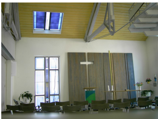
Gemeindehaus in Rauenberg

Meinen verstorbenen Opa. Was er wohl zu meinem Leben sagen würde?