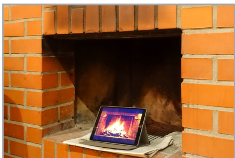
Wir können auch online! Foto Freizeit Neckarzimmern 2019

Eigentlich ist doch alles wie immer... In unserer Gemeinde interessieren sich jedes Jahr viele junge Leute für Gott, genannt „Konfis“. Andere (etwas weniger) junge Leute, sind durch ihre Konfizeit Gott bereits näher gekommen – genannt „Teamer“. Gemeinsam mit der Pfarrerin erleben und gestalten sie ein Jahr lang die Vorbereitung zur Konfirmation: