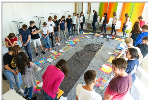
Rundgang zur Bilderschau...

Das persönliche Miteinander fehlt einfach, deshalb ist die Hoffnung auf eine große, gemeinsame Konfirmation am zweiten Maiwochenende groß. Und wenn es nicht sein darf, dann gibt es wieder kleine Gruppen.